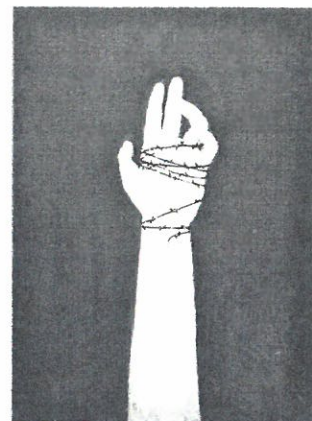
author Dominika Widlarz